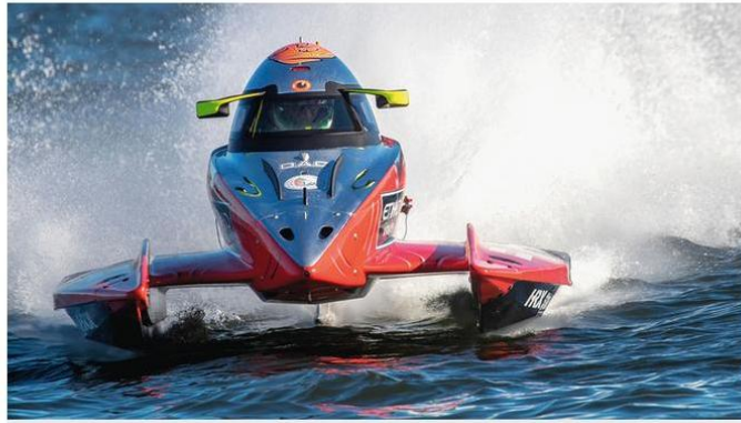
المنافسات تقام على بحيرة خالد في إمارة الشارقة. من المصدر

المصدر: جوني جيور ■ الشارقة التاريخ: 15 ديسمبر 2022