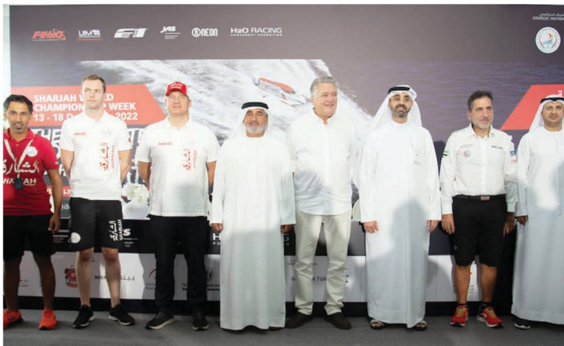
The picturesque Khalid Lagoon will host the 2022 UIM F1H2O World Championship season final for the first time since 2019.

Returning after a hiatus of almost three years following a coronavirus outbreak, the Sharjah World Championship Week comprising double header will determine the outcome of this year's Drivers' Championship.